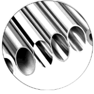
Нержавіюча сталь AISI 304